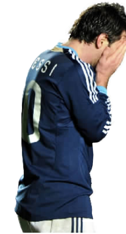
阿根廷队球员梅西伤心掩面。