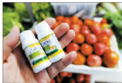
记者在合肥农资市场轻松购买到的“乙烯利”植物生长调节剂。

“这个药剂很便宜，今年1亩地西红柿产量约3000斤，能卖5000多元钱，而药剂的成本也就在5块钱左右。”一菜农说。