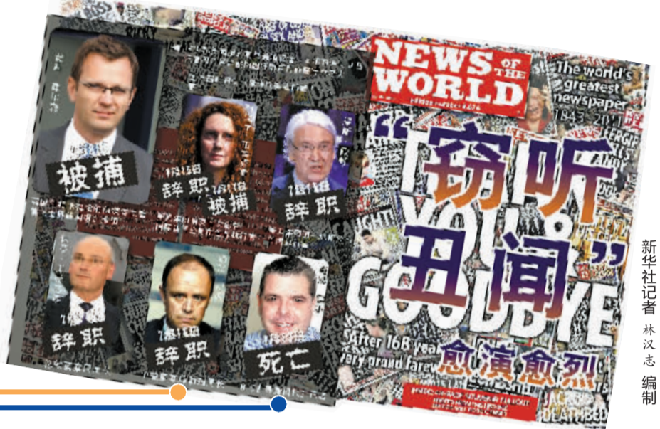
新华社记者林立志 编制

新华社供本报特稿 美国标准普尔评级公司18日警告,随着窃听电话事件的波及范围逐渐扩大,可能下调新闻集团的信用评级。