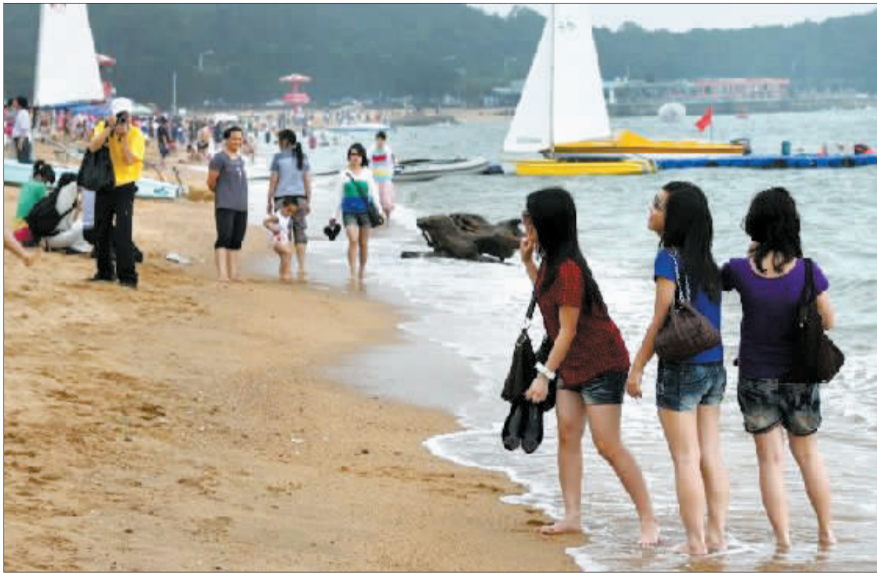
每日都有逾千名泳客在珠海海滨泳场游泳。(资料图片)