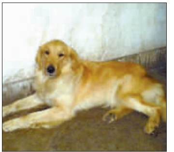
丢失的“阿妮”。