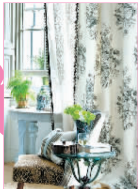
← 窗帘绒球花边装饰

今年夏季,花边在时装界大受追捧,衣服、饰品上的花边装饰很是让人倍添妩媚气质。我们搜罗家居生活中的带花边物件,为您营造炎夏居室的妩媚气场。