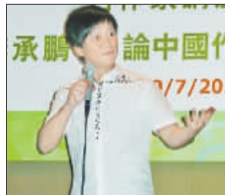
李承鹏在港连称倪萍是好人

出演《裸婚时代》让人气美女姚笛成为今年上半年走势较强的艺人之一,其各种广告代言、商业活动也纷纷而至。日前,姚笛最新写真照(如图)曝光——一向清纯可人的她此次改变风格,演绎红与黑的激情与诱惑,温柔中有几分强势,简单中又添加了一种颓废的美。淑女姚笛一改清纯路线,在这个夏天大变身,成为极富魅力的都市女人。(人民)