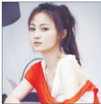
姚笛新写真演绎颓废都市女人

21日晚,刘德华与杜琪峰为“香港新媒体艺术乐园开幕礼”担任主礼嘉宾,杜琪峰称赞华仔十分支持该活动,华仔也表示自己关注新媒体创新和发明,并表示:“在关注科技的同时,不要忘记生活的基本。我本身对科技用品都会好好存放,像以往用过的所有的电话都会放在柜内收藏,即使电脑也不会存隐私,我觉得互联网太过开放,很容易被盗用。”(新华)