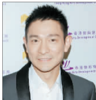
刘德华自曝电脑不存隐私

21日晚,刘德华与杜琪峰为“香港新媒体艺术乐园开幕礼”担任主礼嘉宾,杜琪峰称赞华仔十分支持该活动,华仔也表示自己关注新媒体创新和发明,并表示:“在关注科技的同时,不要忘记生活的基本。我本身对科技用品都会好好存放,像以往用过的所有的电话都会放在柜内收藏,即使电脑也不会存隐私,我觉得互联网太过开放,很容易被盗用。”(新华)