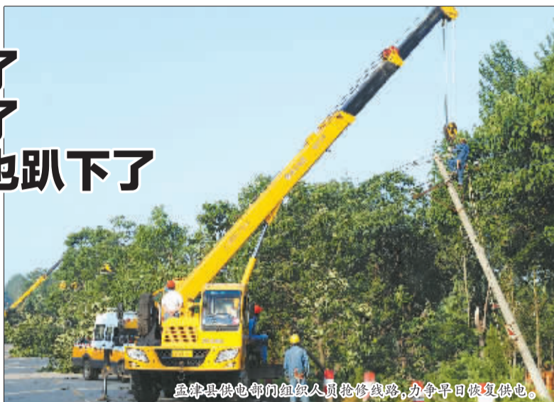
孟津县供电部门组织人员抢修线路，力争早日恢复供电。