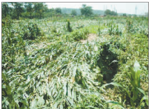
白鹤镇鹤中村玉米大面积倒伏。