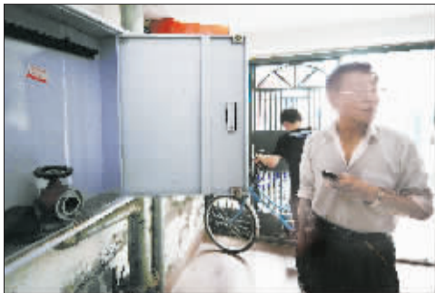
一小区的消防箱里空空如也。