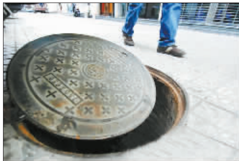
让人提心吊胆的窨井盖。(资料图片)