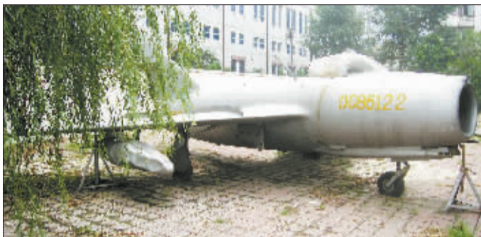
飞机外壳有磨损,有锈迹。