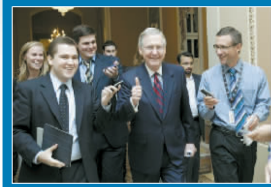
谈判结束,参议院少数党领袖、共和党人麦康奈尔向记者竖起大拇指。

8月1日,美国国会参众两院将对这份协议进行表决,如果获得通过,方案提交总统签署后,就可成为法律。