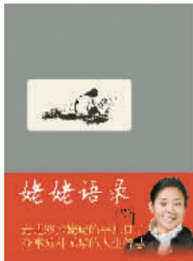
○ 倪萍 著

我也不生了。如果还做主持人、当演员，我就不要孩子也不要家。我盼着现场直播之前，先在一个安静的属于自己的花园房子里睡上一大觉，起来洗个澡、喝一杯咖啡，再清清爽爽地去化妆，精精神神地去演播厅，无牵无挂。晚上舒舒服服地泡上一个