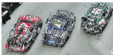
雷霆拯救队 NASCAR trio

雷霆拯救队包括上旋 (Topspin)、神行太保 (Leadfoot) 和路霸 (Roadbuster) 三个角色。《变3》中除了各式各样的超跑和名角之外，三辆被命名为 NASCAR trio (纳斯卡三重奏) 也是影片的一大看点。