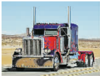
擎天柱 Optimus Prime

汽车人的领袖擎天柱在《变3》里，依然变形为彼得贝奥特 379 型狗鼻卡车 (Peterbilt 379 semi-truck)，但与前作不同的是，这次擎天柱终于配备了车厢，这也是广大粉丝期盼已久的装备。电影里，车厢是擎天柱的超大武器库，而且还可以变形为飞行装甲，让擎天柱翱翔天空，对抗霸天虎强敌。