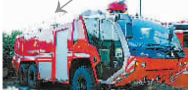
御天敌 Sentinel Prime

在漫画里，御天敌是汽车人以 Prime 命名的第三代领袖 (擎天柱是第四代)。而在电影中，御天敌既是汽车人的前任领袖，也是现任领袖擎天柱的导师。御天敌在地球上变形为卢森堡亚的美洲豹机场救援消防车。