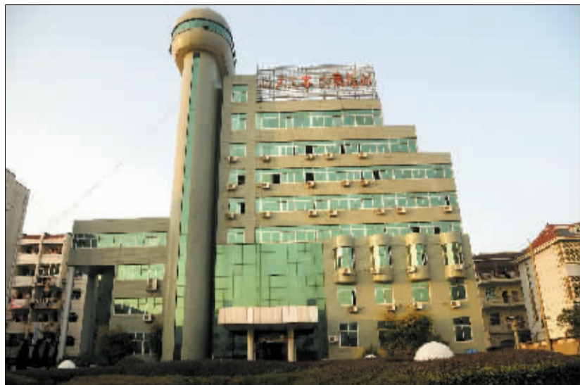
▲ 鄱阳县财政局大楼