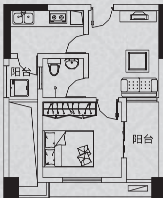
★★ 建筑面积约50m 2 ★★