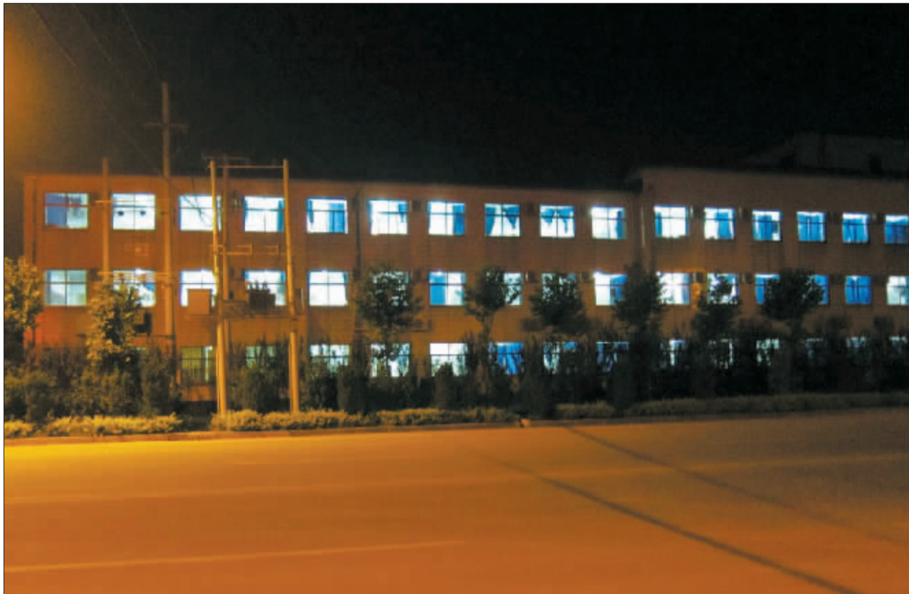
位于河北省故城县的异地补课学校夜晚灯火通明。

当日 21 时许,记者在另一个补习地点看到,几个班级的學生正在上晚自习,并没有老师讲课,學生中有的在看书,有的在聊天,还有的干脆玩起了手机。22 时许,记者返回故城县成龙学校时看到,数十名學生翻墙而出,在街头闲逛。在靠近马路一侧的多间教室中,不少學生交头接耳、玩手机,嬉笑声一片,课堂秩序十分混乱。