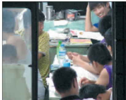
7月25日,异地补课的中學生在上晚自习(视频截图)。