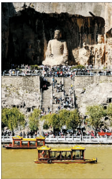
龙门石窟奉先寺