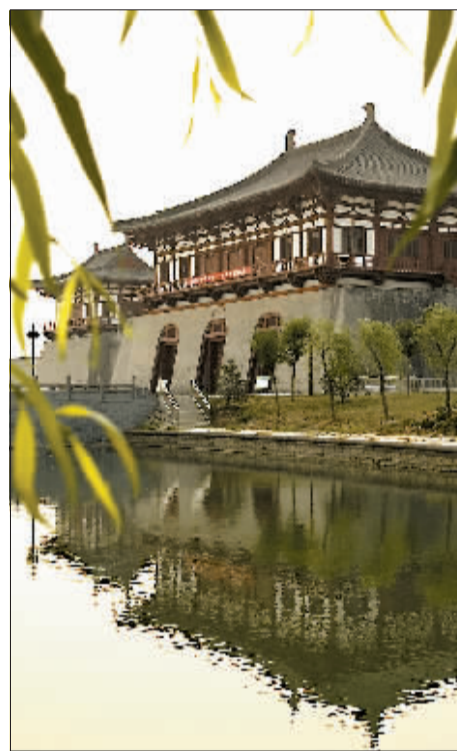
隋唐洛阳城定鼎门遗址博物馆

《十问洛阳》之开篇“一问：中华文明原点今何在？”站在世界发展趋势和中华文明崛起的高度明示：洛阳的文化复兴任重而道远。