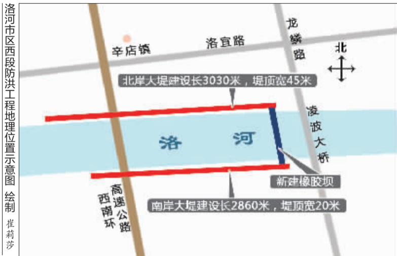
洛河市区西段防洪工程地理位置示意图 绘制 崔莉莎

全省仅洛阳获得;明年牡丹文化节前,洛河市区段有望全部完成治理,防洪标准提高到100年一遇