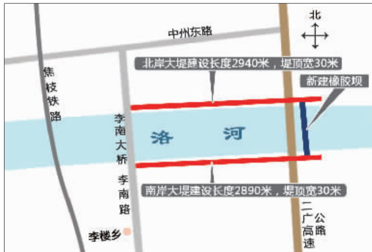
洛河市区东段防洪工程地理位置示意图