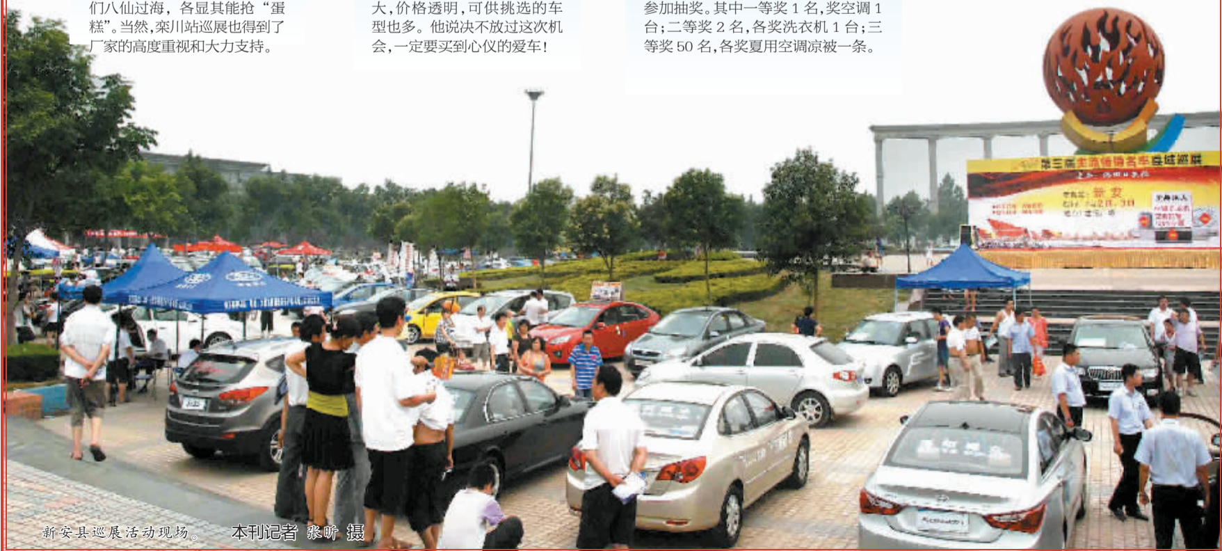
新安县巡展活动现场。

据了解,栾川站活动消息一经发布,许多经销商纷纷致电组委会抢订展位。目前已有20多家经销商确定参展,它们分别是:雷诺、东风日产、北京现代、别克、东风雪铁龙、上海大众、东风本田、长安福特、雪佛兰、东风悦达起亚、斯柯达、长安铃木、风行、长城汽车、野马、比亚迪、海马福仕达、东风小康、哈飞汽车、吉奥汽车、力帆汽车等,将充分满足栾川消费者的多样选择。当然,许多汽车厂家也为本次巡展特批了前所未有的大幅度优惠政策。特别值得一提的是,为了回报栾川人民的厚爱,组委会还将举办现场购车、订车抽奖活动。所有订车、购车的消费者都可以参加抽奖。其中一等奖1名,奖空调1台;二等奖2名,各奖洗衣机1台;三等奖50名,各奖夏用空调凉被一条。