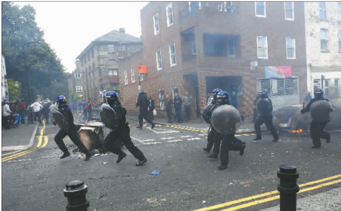
8月8日,在英国首都伦敦东部的哈克尼区,警察向骚乱者推进。

新华社供本报特稿 两天前由英国首都伦敦托特纳姆区点燃的街头骚乱8日夜间蔓延至伦敦多个地区,甚至触发英格兰中部城市伯明翰、北部城市利物浦发生类似骚乱、劫掠事件。伦敦警方增派1700名警员全城戒备,首相戴维·卡梅伦则提前结束休假连夜返回。