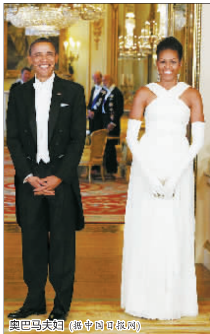
奥巴马夫妇 (据中国日报网)