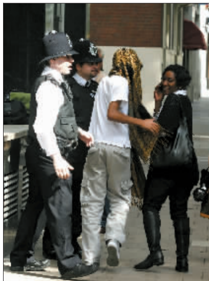
在伦敦，一名涉嫌参与骚乱的年轻人离开威斯敏斯特地方法院。