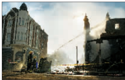
消防员在伦敦给被焚毁的建筑喷水降温。