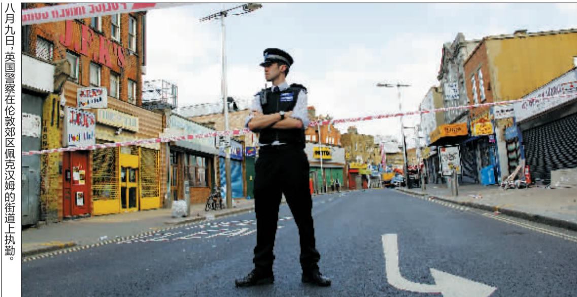
八月九日，英国警察在伦敦郊区佩克汉姆的街道上执勤。