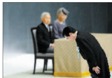
8月15日,在日本首都东京的日本武道馆,日本首相菅直人(前)在“全国战死者追悼仪式”上向战死者鞠躬致意。

布雷维克7月22日在奥斯陆市中心政府办公楼附近引爆炸弹,随后前往奥斯陆以西约40公里处的于特岛,开枪射杀参加挪威工党青年团活动的青少年,致使77人死亡、80多人受伤。