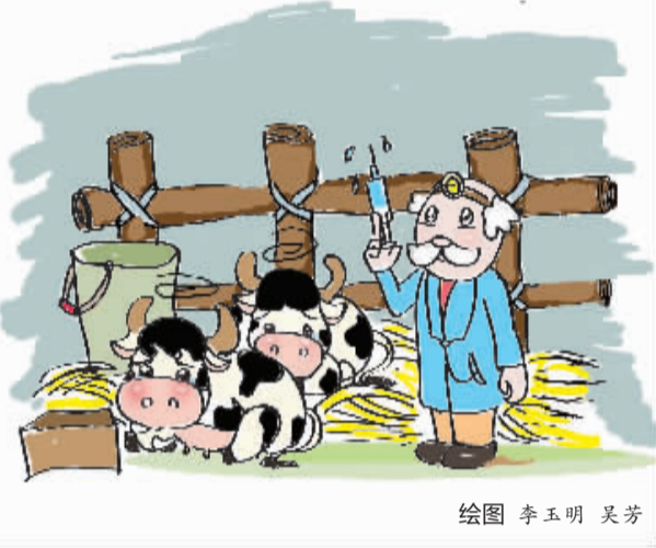
绘图 李玉明 吴芳