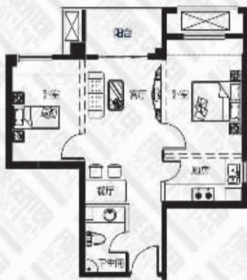
全能小两房 建筑面积约62平方米