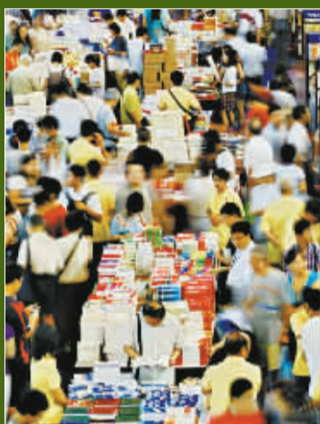
上海书展首日现场。

她说,国外的儿童图画书内容包罗万象,家长完全可以根据孩子的年龄特点、成长需要甚至一段时间里的情绪问题来推荐读物。自己的一个朋友就曾用绘本解决了一个孩子的成长难题:爷爷去世后,孙子一直念叨着“爷爷还在”,于是朋友挑选了《爷爷变成了幽灵》和《外公》两本书跟儿子一起阅读,教会孩子接受“死亡”,用美好的回忆来怀念亲人。