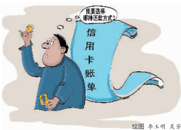
绘图 李小明 吴芳

不少刷卡族,或许都曾这样两难:如何既能享受提前消费,又能每月轻松为信用卡还款。其实,这并不难,银行理财师建议,您只需在最迟还款日之前,通过电话等方式向发卡银行提出分期支付消费金额的申请,银行的账单分期业务就可满足您的需求。不过,各家银行的信用卡账单分期业务门槛、期限、手续费会有所不同,到底哪家银行最划算,还得您自己算清楚。