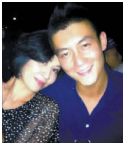
刘嘉玲与陈冠希的合影