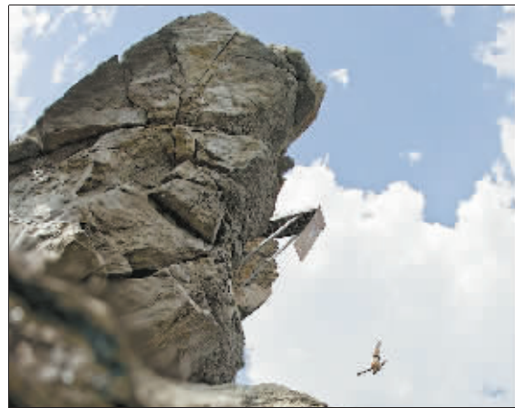
亨特在乌克兰雅尔塔的一跳。

中国日报供本报特稿 据英国《每日邮报》9 月 5 日报道,英国人加里·亨特连续第二年获得了“红牛杯”悬崖跳水世界系列赛总冠军头衔。