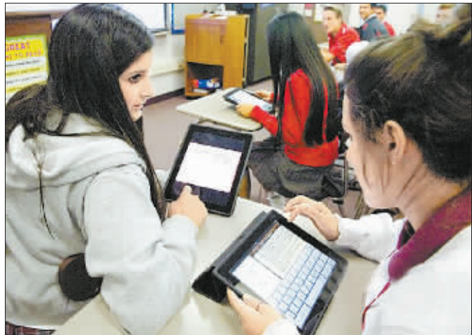
加州一所中学的学生正在使用 iPad。