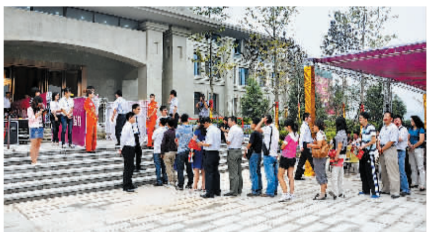
9月3日,备受关注的住总·鼎城举办了盛大的VIP认筹活动,近千组意向客户参与此次活动。截至下午4时,认筹VIP卡523张,整个排号活动取得圆满成功,住总·鼎城的精彩登场也给略显沉闷的2011年下半年楼市注入了新的活力和热情。

而开发商为冲击今年销售业绩、尽快回收资金,降价促销力度将维持现有政策,甚至还将会加大。谢逸枫分析,“一些主流开发商采取降价换量的策略,其他开发商也可能采取跟进策略。我认为‘金九银十’成交量会比前几个月有大幅增加”。(新华网)