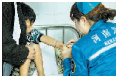
一名儿童因受到过度惊吓，躲在父亲身后接受治疗。