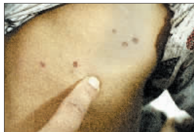
被蜇伤的学生背部有多处伤口。

我们了解到，为给孩子看病，这些家长们已花费1000多元至近5000元不等。而据乡中心校一名负责人说，自从学生们出事后，县里和乡里的教育部门都非常重视，每天都安排人员在医院了解学生们的病情，还垫付了一部分医药费。