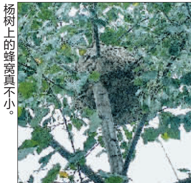
杨树上的蜂窝真不小。