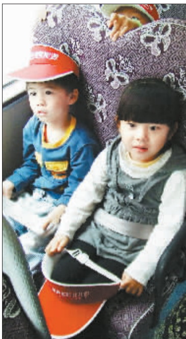
坐椅是专为儿童设计的。