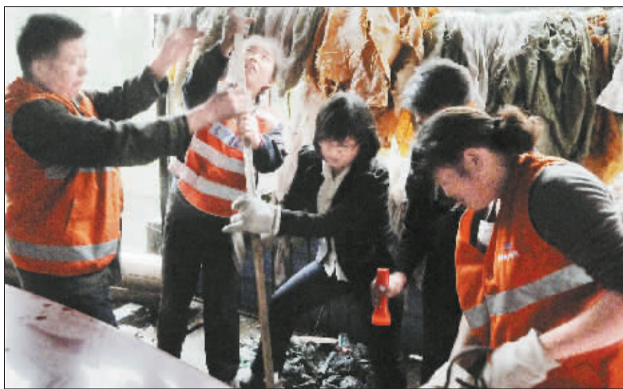
记者(中)和管道工一起疏通窨井。

■编者按 在我们身边,有许许多多的行业不为人所了解,不为人所关注。这些行业的从业者是我们衣食住行的“守护者”,而我们对他们却熟视无睹。