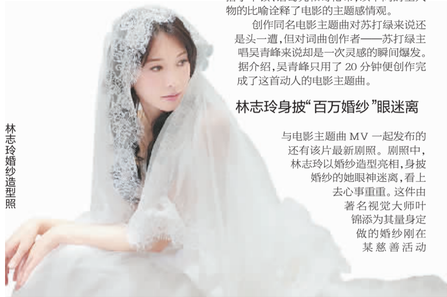
林志玲婚纱造型照

19日,《幸福额度》剧组爆出新闻,台湾人气偶像组合苏打绿演唱的电影主题曲MV与林志玲的婚纱造型照同时发布。出品方还正式公布了影片上映日期:10月20日。