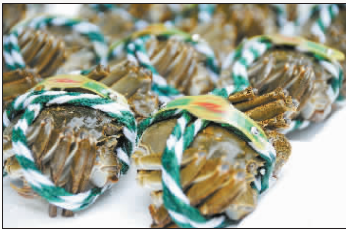
被“五花大绑”的大闸蟹

而在另一家水产店,女老板直接拿出了一把腰带,上面印有“阳澄湖特产一级品”、“阳澄湖大闸蟹养殖基地”等字样,但没有数字编码。她说:“好多送礼的想要这个,一捆就行了。”这些蟹的价位偏低,从每斤35元到55元不等。“真真假假谁分得清呢?顾客注重的是口味。”一名导购员说。