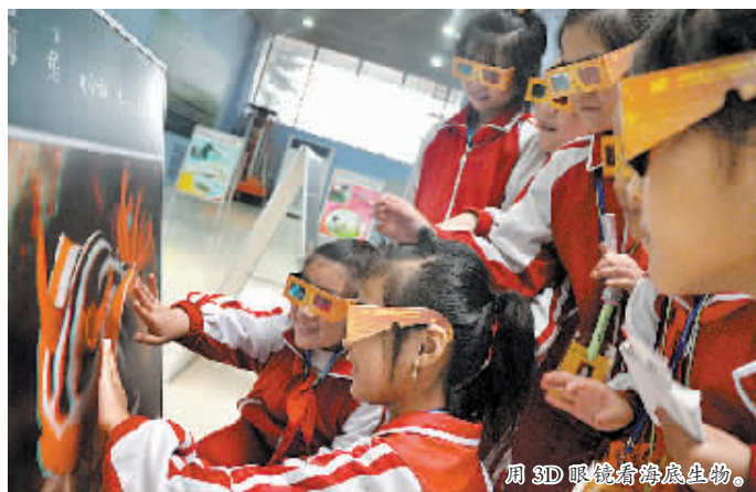
用3D眼镜看海底生物。

在老师的带领下,小记者认真地观看每一块科学宣传展板,听讲解员讲解科学知识。展览通过图片展示、实物演示、动手体验等形式,让小记者们身临其境地感受到了科技的魅力,体验学习科普知识的乐趣。科技馆所展出的“洛阳科技与进步”、“汽车与安全”、“科学应对慢性病”、“珍惜生态环境、走进低碳生活”等内容,让小记者们对新颖有趣的科学知识、日常生活中的科学知识和新奇的发明创造产生了强烈的好奇心和浓厚的兴趣。