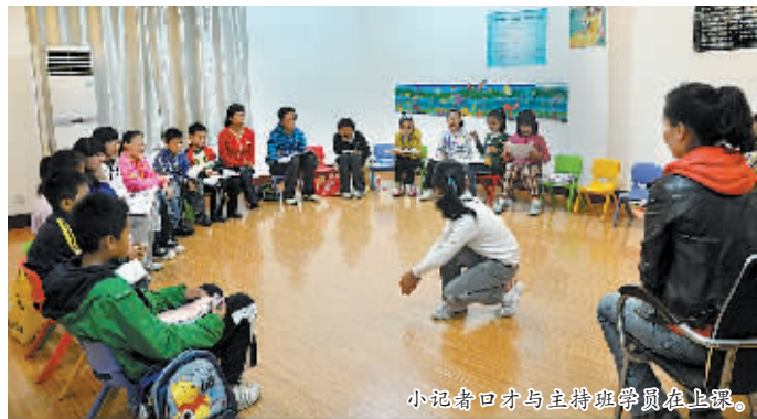
小记者口才与主持班学员在上课。

小记者口才与主持班、阅读写作双项班9月班已经火热开课了,近百名小学员在这里学到了本领,得到了自信,收获了从来没有过的快乐。为满足因名额有限而未报上培训班的小记者,小记者特色培训班将于10月开办更多、更具特色的课堂。