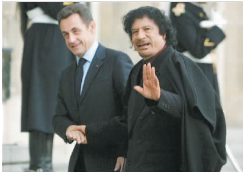
萨科齐(左)与卡扎菲是“昔日的好友”。

综合新华社消息 埃及媒体9月20日报道,穆阿迈尔·卡扎菲前几天在利比亚南部城市塞卜哈现身。