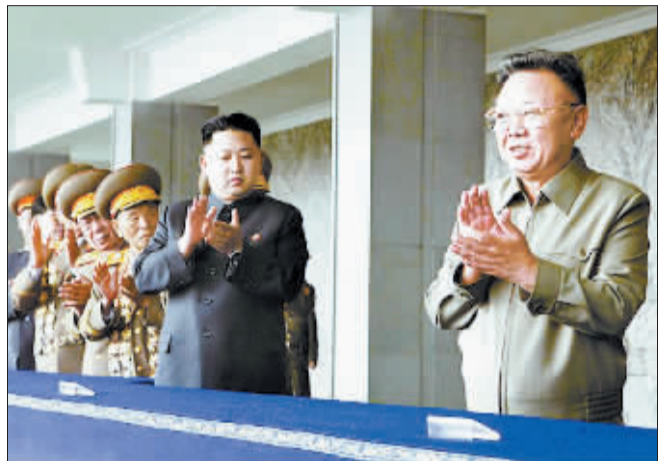
金正日(右一)和金正恩(右二)出席庆祝朝鲜劳动党成立65周年纪念活动。(资料图片) (据新华网)

中国日报供本报特稿 据韩国《中央日报》9月22日报道,朝鲜领导人金正日的接班人、朝鲜劳动党中央军事委员会副委员长金正恩正在对朝军进行改编。同时,朝鲜居民家中也将会悬挂金正恩的肖像。