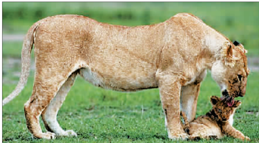
抵达安全地带后，母狮舔舐幼狮的额头，似乎在告诉它：“我们安全了，别怕。”

野生动物摄影师让-弗朗索瓦·拉戈特日前在肯尼亚拍到一组母狮救子的精彩画面。一头幼狮跌下悬崖后，被困在陡峭的斜坡上，身下就是万丈深渊。幼狮的妈妈与另外三头母狮以及一头公狮发现了险情，它们聚在悬崖边，似乎在商量对策，但陡峭的坡度让另外四头狮子望而却步。幼狮的妈妈冒着可能坠入悬崖的危险，小心翼翼地下到幼狮被困的地方，将它叼起来，又步步惊心地把它带回安全地带。