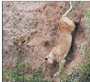
母狮冒着生命危险下崖救子。