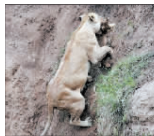
母狮艰难地将幼狮带回。