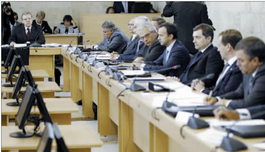
9月26日,库德林(左)与梅德韦杰夫(右二)一起出席会议。

俄罗斯副总理兼财政部长阿列克谢·库德林26日宣布辞职。按他本人的说法,他与总统德米特里·梅德韦杰夫在经济政策方面分歧严重,辞职皆因梅德韦杰夫压力所迫。梅德韦杰夫随即批准库德林辞职。