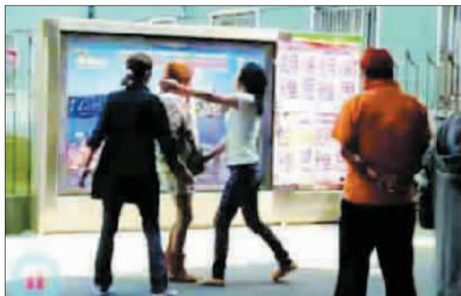
视频中,一女子猛扇女大学生的耳光。

小时的时间里,已经播放了超过23万次。一名不愿透露姓名的学生告诉记者,打人事件发生在常州工学院本部南门附近,事件中的男主人公为学校附近某理发店的老板。