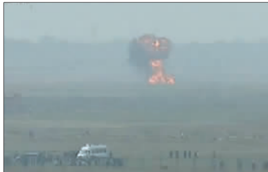
央视 相关报道 截屏图。