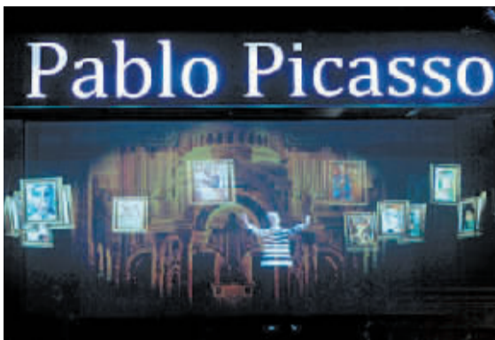
“2011 毕加索中国大展”在沪揭幕。（网络图片）