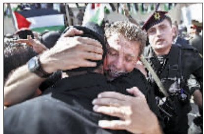
巴勒斯坦被释放囚犯与亲人相见。