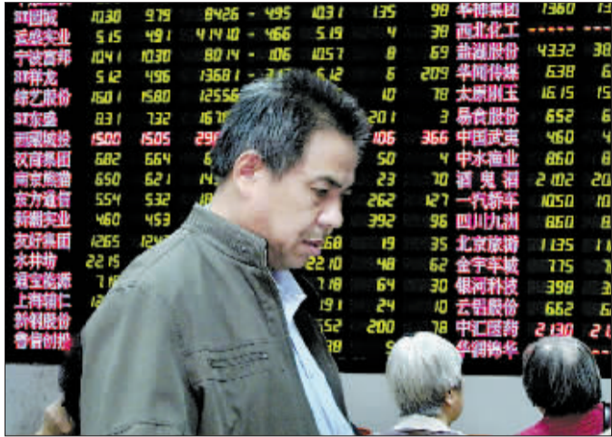
2011年10月20日,沪深股市大幅下跌。