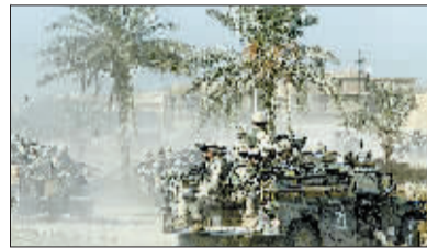
2003 年 11 月 7 日，驻伊美军在伊拉克费卢杰进行武器搜缴行动。