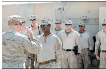
14 日，驻伊美军进行交接仪式。(据《中国日报》)