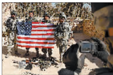
2008 年 3 月 5 日，驻伊美军和伊拉克警察在伊拉克巴古拜手举美国国旗合影。

数千计来自美国私营企业的保安和培训人员也将驻留伊拉克，帮助伊方部队熟悉美方提供的坦克等军事设备。