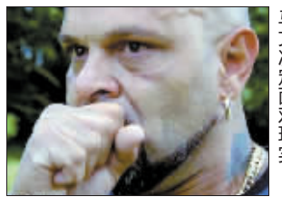
马文决定面对现实。