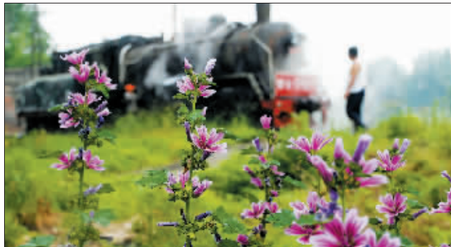
蒸汽机车的春天虽已逝去,但给许多人留下永恒的记忆。

曾经辉煌的蒸汽机车,已淡出人们的视野。在一些货场和厂矿,还能看到它们有些苍老的身影。据了解,目前全国仍在运行的蒸汽机车有170台,我市有5台,其中4台在洛阳钢厂承担货运任务。