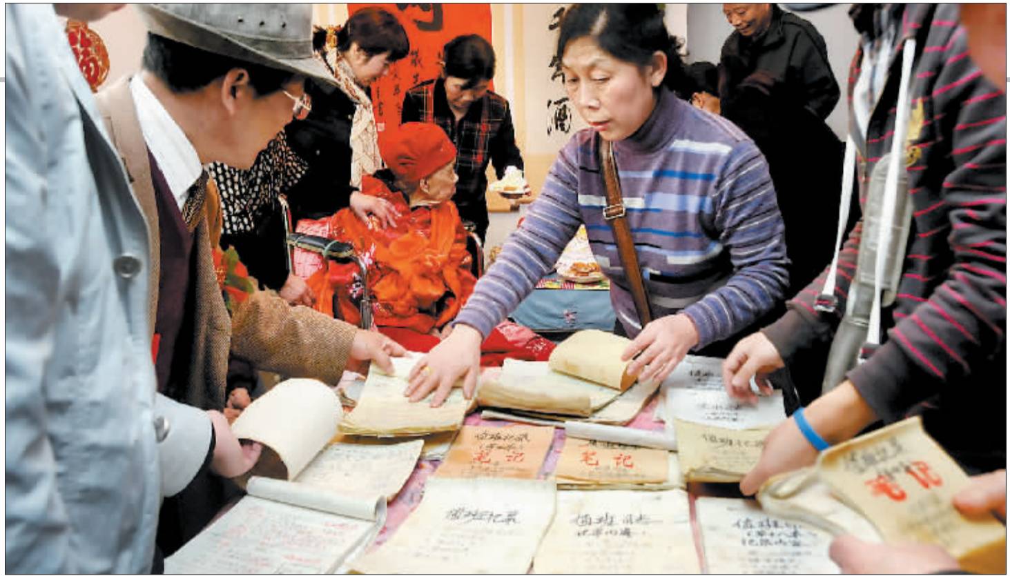
「桌子」护妈日记十分引人注意。