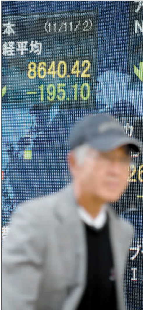
十一月二日, 东京股市日经股指大跌百分之二点二。