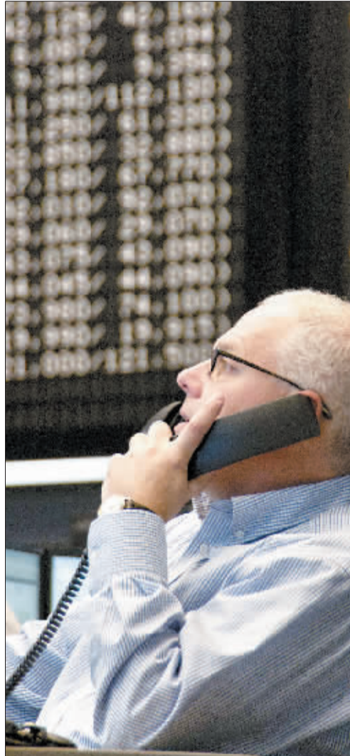
十一月一日, 德国法兰克福股市下跌百分之五。